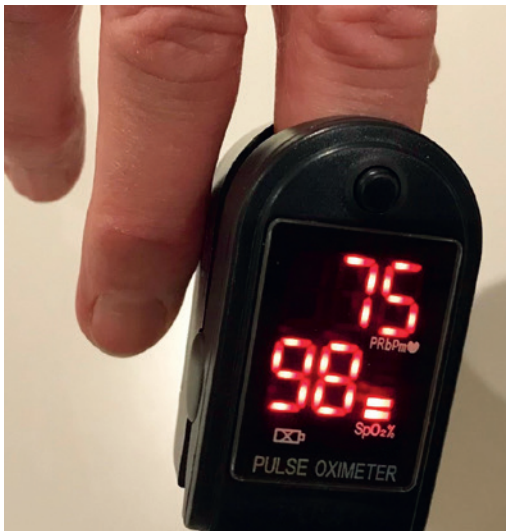
Figuur 1. Saturatiemeter.

Thuismonitoring maakt het mogelijk dat patiënten met of zonder zuurstof eerder kunnen worden ontslagen vanaf de afdeling. Patiënten krijgen een saturatiemeter mee naar huis (figuur 1).